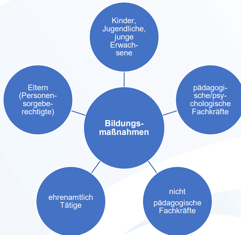
Abbildung: Zielgruppen der Bildungsmaßnahmen

Die in der Abbildung angeführten Zielgruppen, sollen mit den Bildungsmaßnahmen erreicht werden.